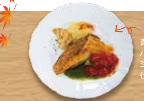
真鯛のポワレをハイアはさみ、ミルフィーユ仕立てに仕上げました。