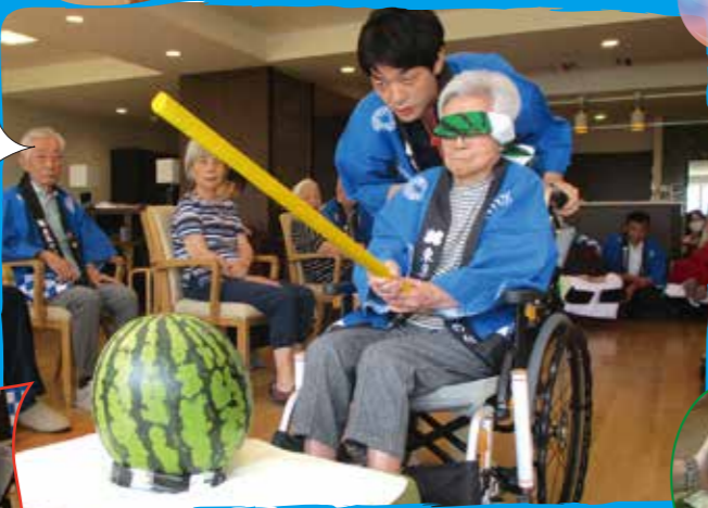
童心に返ってゼリーすくいゲーム