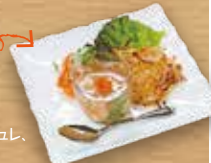
前菜の3種盛りです。スモークサーモンのカルパッチョ、彩野菜のコンソメジュレ、じゃが芋のガレット。