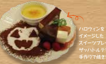
ハロウィンをイメージしたスイーツプレート。サツハトルテを手作りしました。