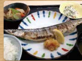
魚は高温で一気に入れ、柔らかくジューシーに焼きました。