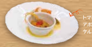
トマトのカプレーゼとアボカドとサーモンのタルタルです。