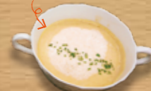
ポタージュは野菜の旨味と甘味を最大限に引き出すため、水を使わずに無水調理で仕上げました。