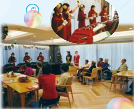
ハンドベルの響きと透き通った音色にうっとり ♪ハンドベルコンサート♪