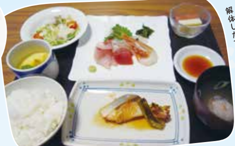
開業1周年のランチは、 解体したフリがメインです。