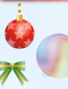
シェフこだわりの クリスマスランチ