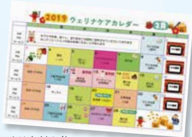
イベントカレンダー