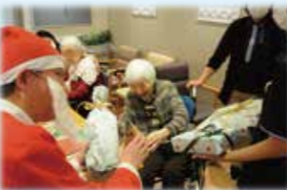
サンタさんから うれしいプレゼント